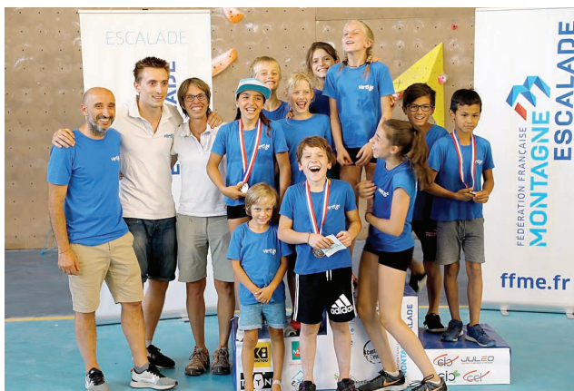
Les neuf grimpeurs de Vertige sur le podium national, symbole d'une réussite collective.